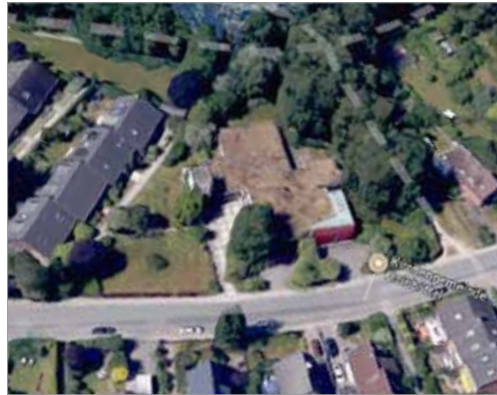
Heute: Google Maps

Die Pläne des Investors sind auf der Website der Gemeinde Ammersbek veröffentlicht. Auf unser Website findet ihr den entsprechenden Link. lottbeker-IGEL.de