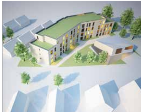
Morgen? Entwurf PGH