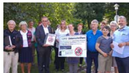
Der Lottbeker IGEL übergibt 1013 Unterschriften an Bürgermeister Ansén.

Von den Unterschriften stammen 74,8% von Ammersbeker Bürgern. Wir bedanken uns bei allen die für die Einhaltung der 1-geschossigen Bauweise, den Erhalt des Grünstreifens und für die Mitwirkung der Bürger an der Planung auf dem Kirchengelände An der Lottbek unterschrieben haben. Jede Unterschrift zählt und hat Gewicht, daher werden wir auch weiter Unterschriften sammeln! Der Aufstellungsbeschluss für das Kirchengrundstück wurde in der Bauausschusssitzung durch einen Antrag der SPD und Befürwortung dieses Antrages in einem positiven Abstimmungsergebnis durch die Mehrheit von CDU und SPD von der Tagesordnung genommen. Es ist noch alles offen. Das gibt uns die Möglichkeit zuerst mit der Kirche zu sprechen. Wir hoffen in unserem Gespräch mit der Kirche am 27.06.17 ein alternatives Konzept zu erarbeiten. Über das Ergebnis werden wir berichten.